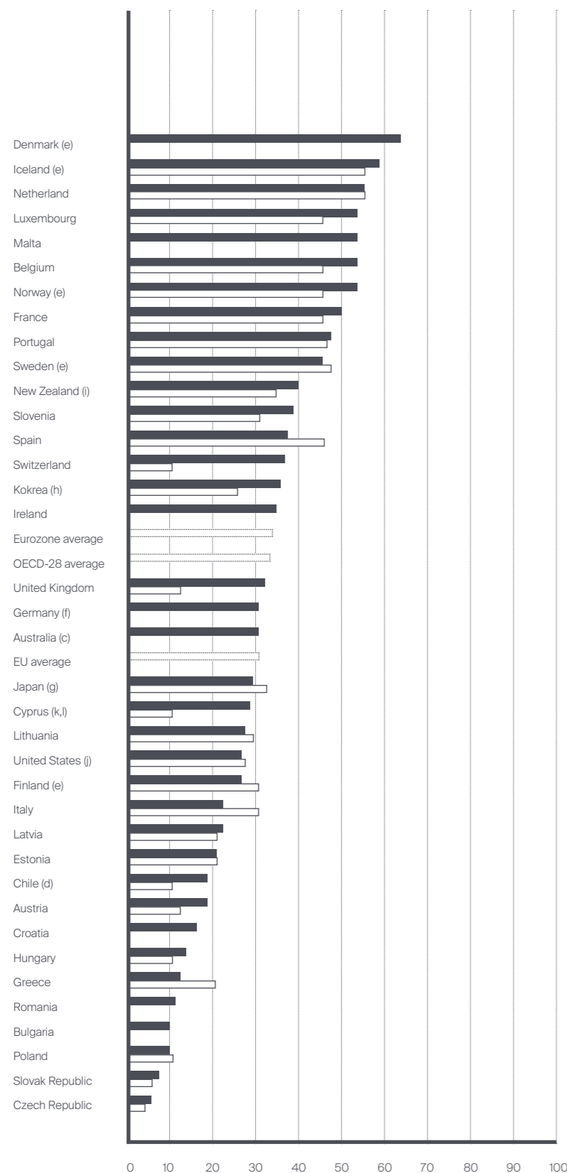
GRÁFICO N.º 1 Percentagem de crianças entre os 0 e os 2 anos que frequentam infantários e outros equipamentos sociais para este estrato etário

FONTE OECD Family Database (dados atualizados em 09/10/16)